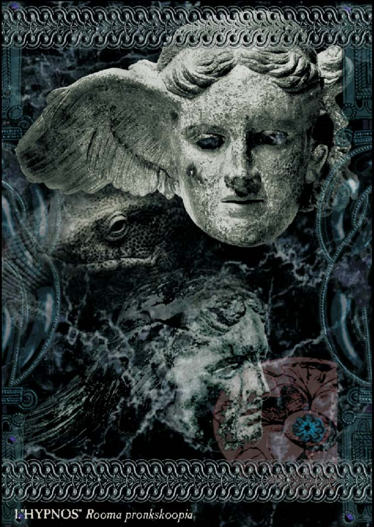
1. "HYPNOS" Rooma pronkskoopia