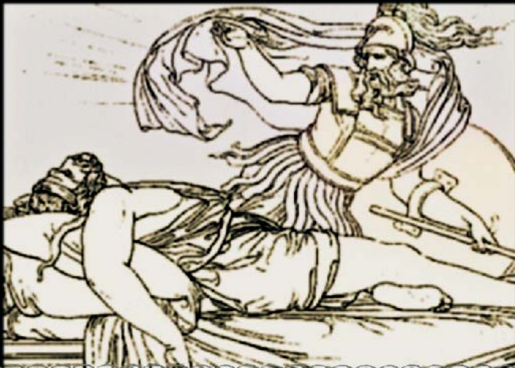
5. "ONEIROS ILMUB AGEMEMNONILE"