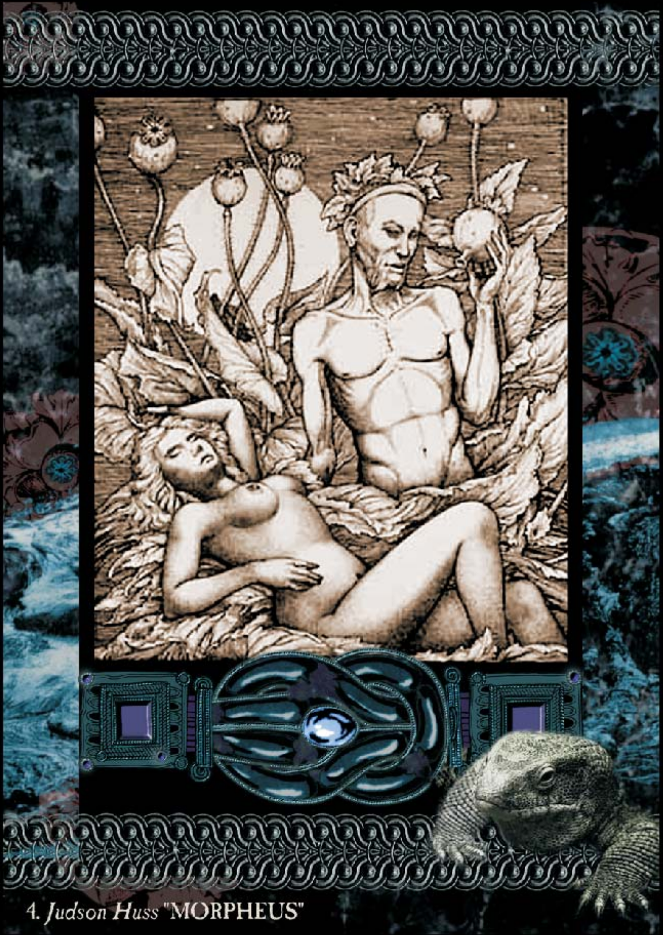
4. Judson Huss "MORPHEUS"